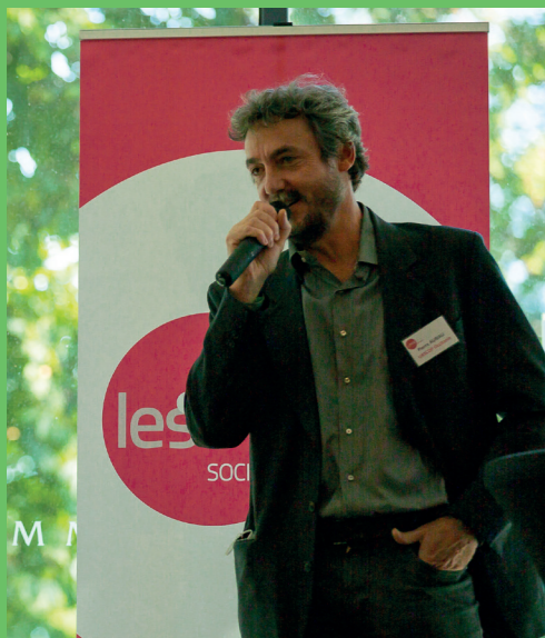
Après la présentation du rapport d'activités par les équipes des deux pôles, l'après-midi a été consacrée au travail en ateliers.